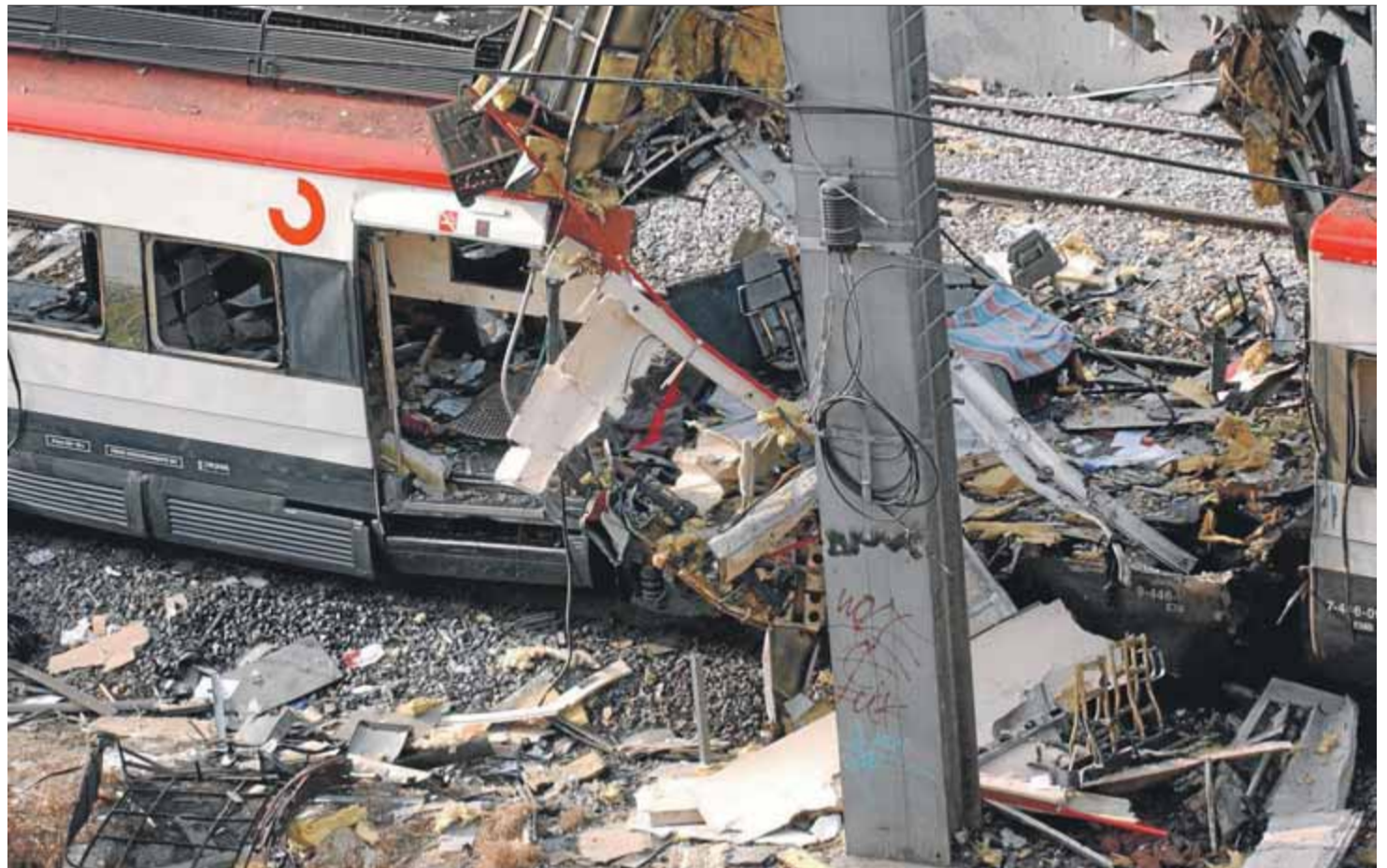
Un dels vagons rebotats per l'explosió a l'estació d'Atocha de Madrid durant els atemptats de l'11-M

Un dels primers polítics a donar la cara és Juan José Ibarretxe. Passen pocs minuts de dos quarts de deu