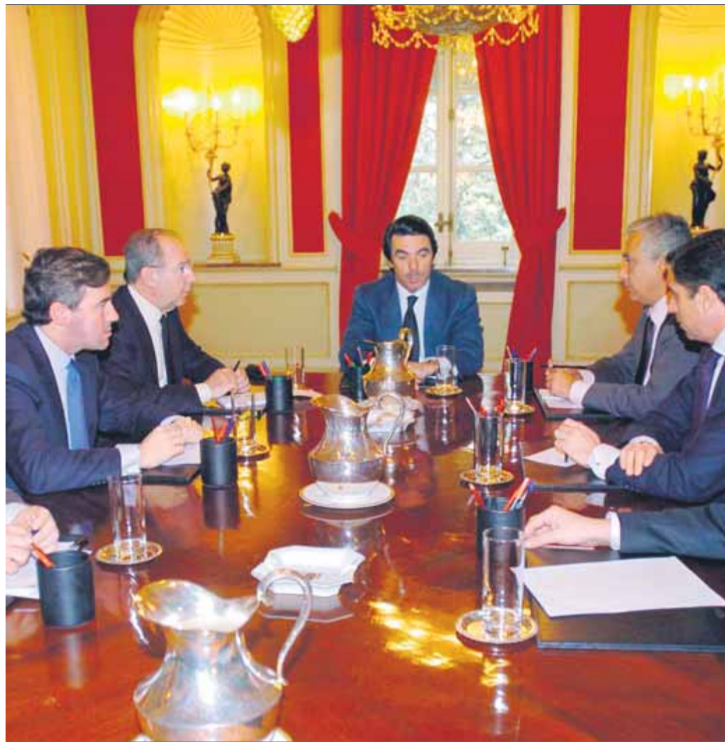
L'aleshores president espanyol, José María Aznar, amb el seu gabinet de crisi

El dijous, dia 12, les dades que desvinculen ETA dels atemptats ja són evidents. La policia havia desactivat una bossa amb explosius extraviada entre els equipatges i comença a filtrar proves a la premsa. A partir d'aquell matí, la treva amb el principal partit de l'oposició, el PSOE, es trenca. En una entrevista matinal, el secretari d'organització socialista, José Blanco, afirma que