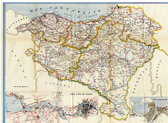
Zazpi ken lau 1953an argitaratu zuen Pio Barojak El País Vasco liburua (Euskal Herria). Tuteratik Baionaraino egindako ibilaldia kontatzen zuen bertan, eta zazpi herrialdeak zituen mapa hau ere bazuen orrien artean. 1988an, baina, liburua berriz editatzea erabaki zuen Madrilgo argitaletxe batek. Bigarren edizioan, zazpi herrialde zirenak hiru bihurtu zituzten editoreek eta Caro Baroja idazlearen semeak. Araba, Gipuzkoa eta Bizkaia soilik. Frankismoan zazpi zirenak demokrazian hiru bilakatu ziren. / MAPAS PARA UNA NACION / --