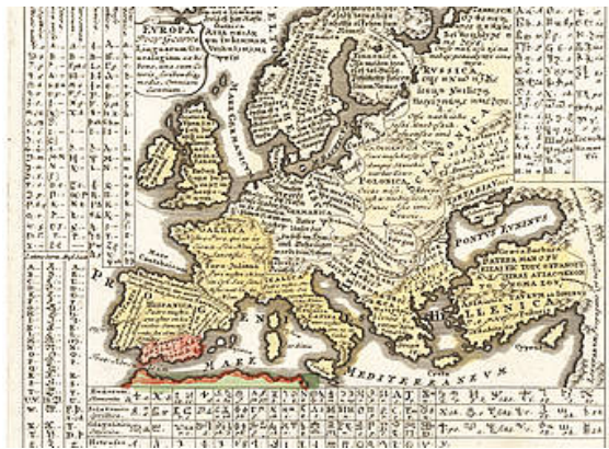
Hotsen mapa. 1730ekoa da mapa hau. Alemaniarra. Lehen mapa linguistikotzat jotzen dute adituek, eta «Aita gurea» errezoaren lehen hitzen hotsak biltzen dira bertan. Euskarazkoak ere bai beste guztien artean; Kantauri itsasoko kosta guztia hartzen du, gainera. / MAPAS PARA UNA NACION / --