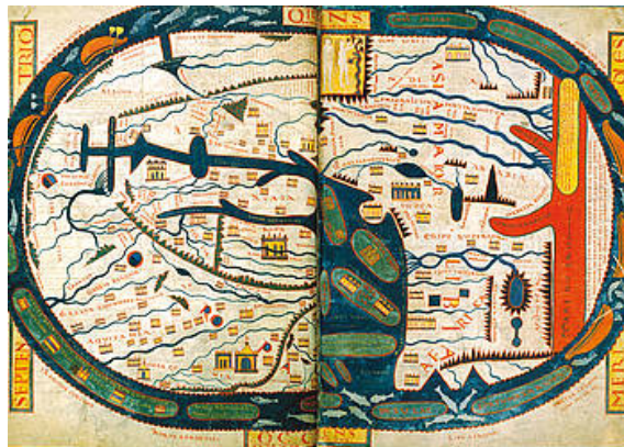
'Wasconia'. XI. mendekoa da mapa hau. Garaiaren isla. Mundua da bertan irudikatu uste zutena, eta Euskal Herriak ere badu bere txokoa bertan. «Wasconia» ikus daiteke bertan idatzita, mapa erloju bat balitz zazpi zenbakiari egokituko litzaiokeen lekuan. Ibai, etxe eta mendien irudiak inguruan. / MAPAS PARA UNA NACION / --