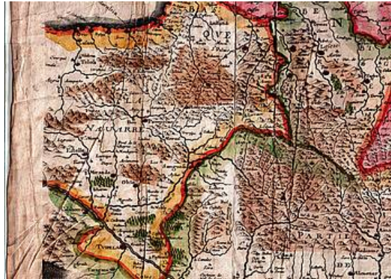
Konkistaren dema. 1512an konkistatu zuen Gaztelak Nafarroako Erresuma, baina 1642koa da mapa hau, eta bertan erresumak eutsi egiten die oraindik bere mugei. Frantziarrek egindakoa da, eta Espainiaren eta Frantziaren arteko mugak ageri ditu. Nafarroan kokatzen ditu mugarriak mapak, eta ikusten denez konkistaz geroztik mende bete baino gehiago pasa arren, frantziarrek oraindik ere aitortu egiten zuten Nafarroako Erresumaren lurraldetasuna. Betiere, beren orbitaren barnean. / 'MAPAS PARA UNA NACION.' / --