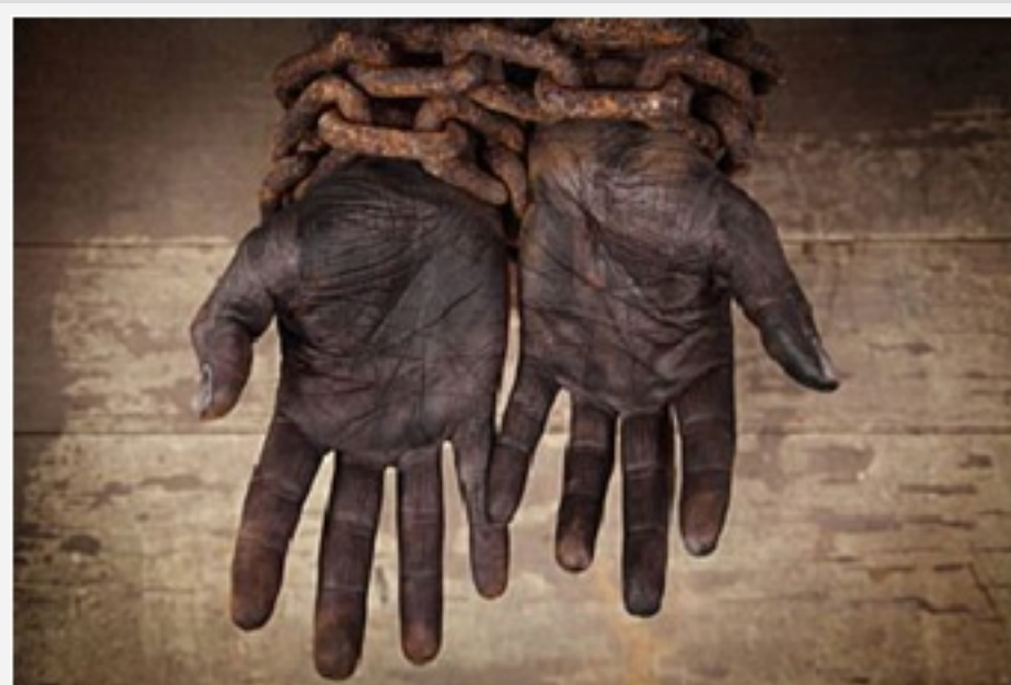
XIX. mendeko Kubako esklabotza kapitalismoaren aurpegirik makurrena izan zen

Euskaldunek Kubako independentzia gerretan izandako jokaeraz liburua argitaratu du Txalapartak: Patria y libertad. Los vascos y las guerras de independencia de Cuba (1868-1898) . Benetan gomendagarria. Irakurlea segituan konturatuko da euskaldunak mundutarrak garela. Liburua hezurramitzen duen aferatako bat esklabotza da. Ezin bestela izan XIX. mendeko Kubaz aritzean. Eta esklabotzaz aritzean, ezin Julian