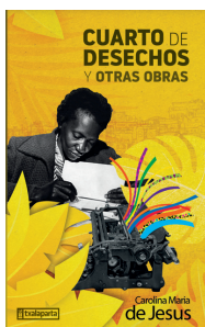
CUARTO DE DESECHOS Y OTRAS OBRAS CAROLINA MARIA DE JESUS