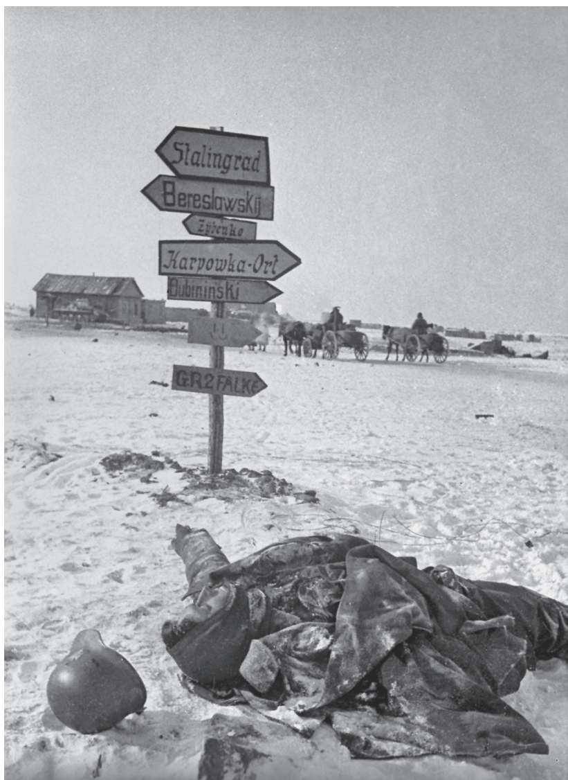
Stalingrado, 1943.