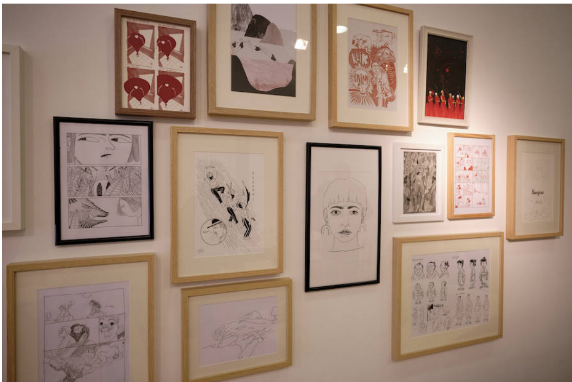
Aste honetan zehar Donostiako Komikigunean ikus daitezke hainbat marrazki.